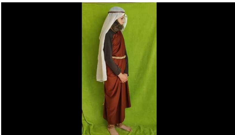
Cała postać na tle green screen-a.

Anioł spogląda w dół na klęczącego przed nią Jezusa. Nic nie mówi. Ręce złożone do modlitwy.